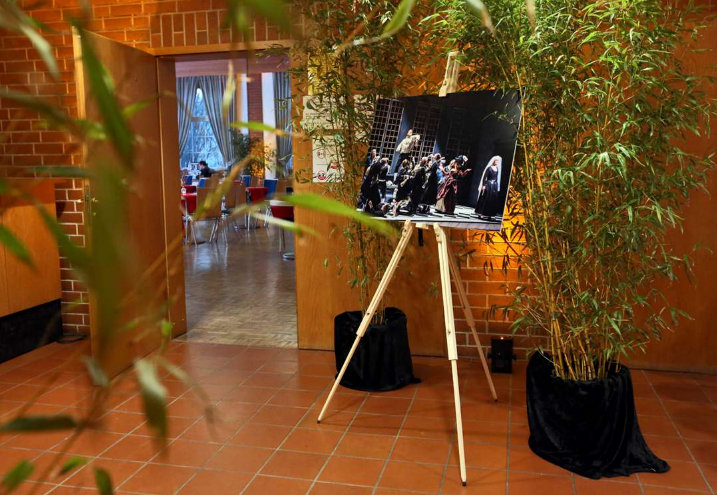
© Julia Moras | „Die Hochzeit des Figaro“ | Eingang zum Festsaal