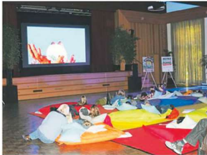
Gemütlich in die Sitzsäcke gekuschelt folgen die Kinder dem Theaterstück über einen Livestream auf der Leinwand.