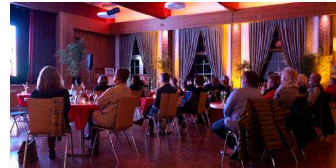
Festsaal Delligsen, „Schmidt's Katzen“