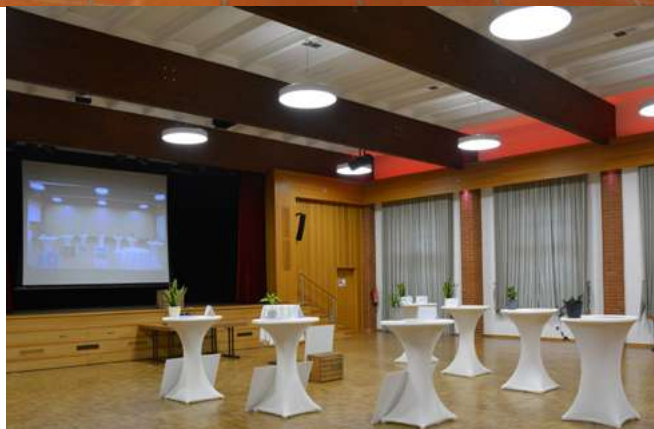
Festsaal Delligsen vor dem Pressegespräch